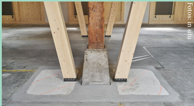
Zirkulatiokon: Re-use von Betonelementen | Werkstattareal Zürich