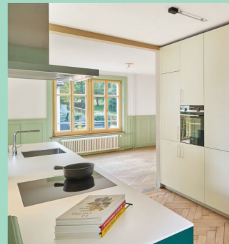
Adaption: Bauen im Bestand | T