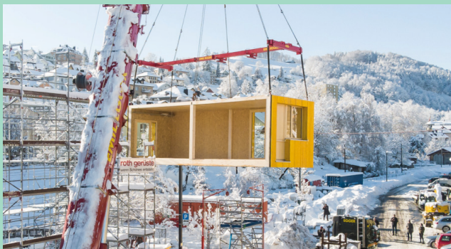
Modulation: Bauen mit Modulen | Lattich St.Gallen

Wir freuen uns auf Ihr Kommen und Ihre Inputs!