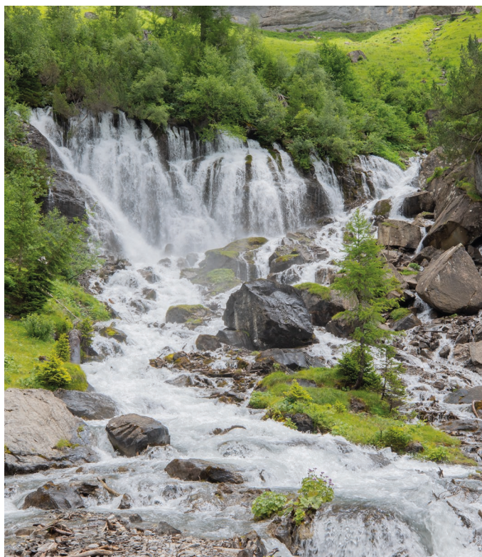
Aus den "D'Sibe Brünne" - der Quelle der Simme, tritt das im Kalkstein versickerte Wasser des Gletschers Plaine-Morte wieder zu Tage.