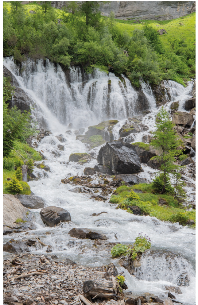
Aus den "D'Sibe Brünne" - der Quelle der Simme, tritt das im Kalkstein versickerte Wasser des Gletschers Plaine-Morte wieder zu Tage.